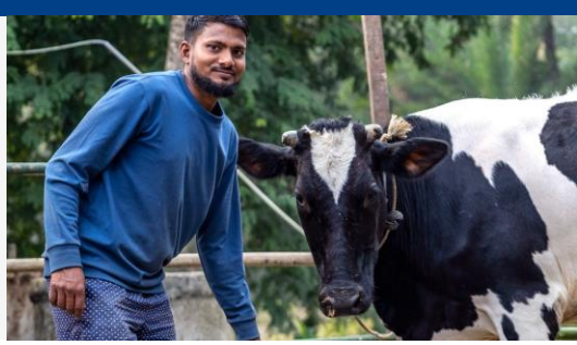
Projeto de Inovação Bangladesh

Conheça nossos objetivos e os progressos feitos em 2023 nas cinco áreas de foco da nossa agenda de sustentabilidade.