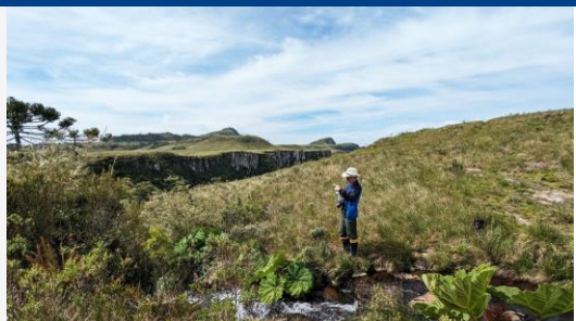
© Programa de Conservação do Aracari, Brasil