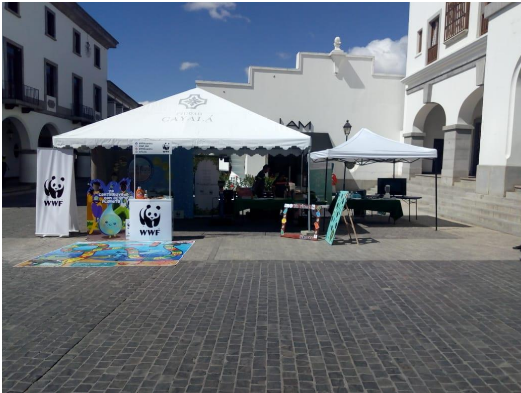
Imagen 1. Material y montaje para la actividad Eco-Reto.